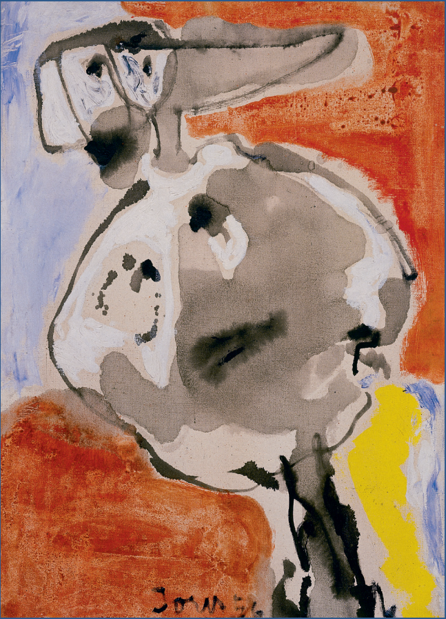
Asger Jorn · Bird · 1956 · Oil on canvas · 70 x 50 cm · Würth Collection · Inv. 1902