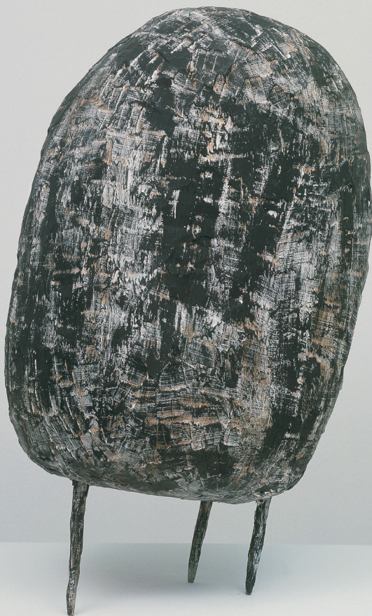
Alfred Haberpointner · Weighting · 1991 · Painted Nut Tree · 58 x 31 x 39 cm Würth Collection · Inv. 1806

© Alfred Haberpointner