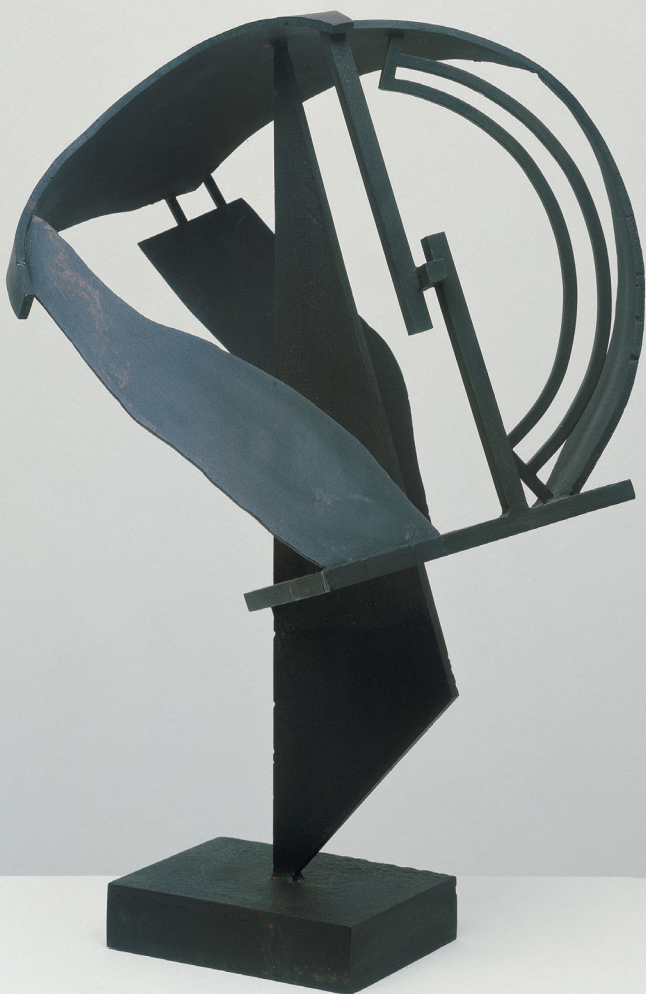
Robert Jacobsen · Universum · 1990 · Iron · 60 x 35 x 40 cm Würth Collection · Inv. 3397

© Robert Jacobsen / VISDA · Photo: Philipp Schönborn, München